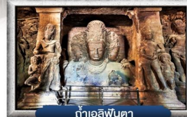
ถ้ำเอลิฟินตา