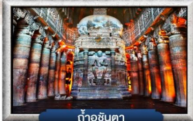
ถ้ำชันตา

☑ ชมนครแห่งถ้ำบนเกาะในทะเล "ถ้ำเอลิฟินตา"